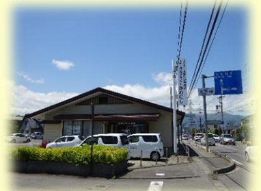
川西地域包括支援センター（デリシア川西店様となり）