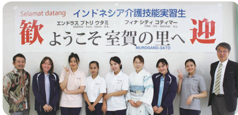
先輩実習生 4 人も交えて記念撮影