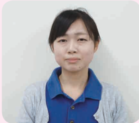
相談員（社会福祉士）