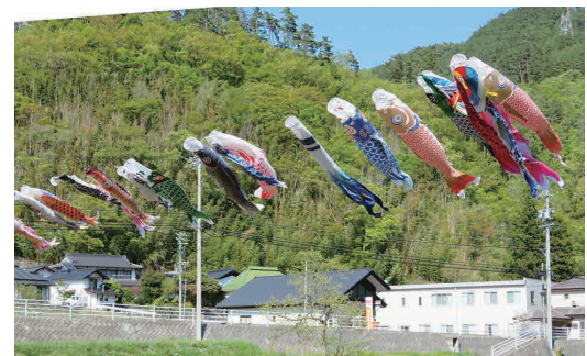
室賀郵便局と室賀の里を背景に…パチリ！

4月の末からゴールデンウィークにかけて室賀地域の公民館の方々によって、沢を渡し沢山の鯉のぼりが掲げられました。爽快でした！