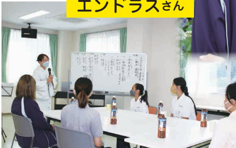
ナースが 和装で出席さ れました。