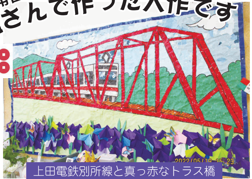
上田電鉄別所線と真っ赤なトラス橋