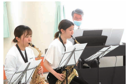
歓迎会で演奏をする『室賀の里山の音楽隊』職員の 皆さん。

入国後、1ヶ月の研 修を経て6月8日に室 賀の里へ到着しました。 6月10日に開催した 歓迎会では、施設長と 職員による演奏で会を 盛り上げ、日本の文化 を紹介したい、と着物 姿で参加した職員が花 を添えました。 先輩の技能実習生4 名と共に新しい寮での 生活もスタートしてい ます。