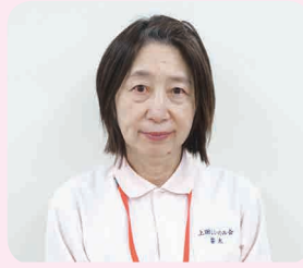
相談員（介護支援専門員）

育児のため長いお休みをいただいておりましたが、4月より復帰させて頂くこととなりました。高齢者の皆さまが住み慣れた地域で安心した生活を続けられるように、温かい心と冷静さを持って向き合っていきたいです。これからも頑張っていきたいのでよろしくお願い致します。