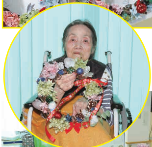
クリスマスリースを利用者様と一緒に作りました。