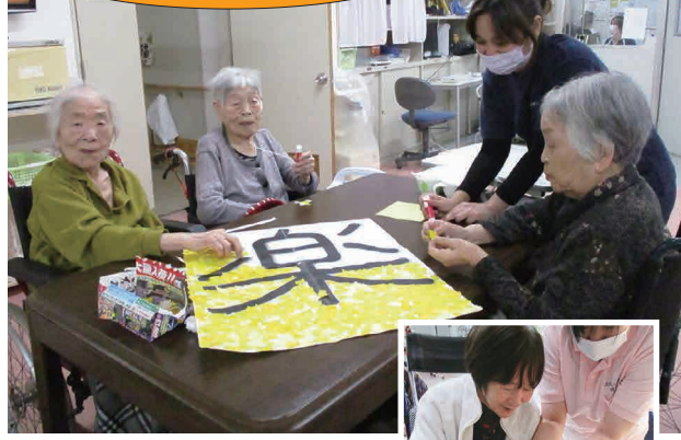
おやつと一緒に作りました。