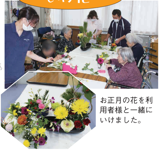
お正月の花を利用者様と一緒にいけました。