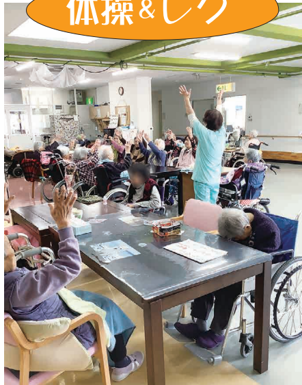
余暇では積極的に、軽い体操やレクリエーションで楽しく、安全に体を動かすようにしています。