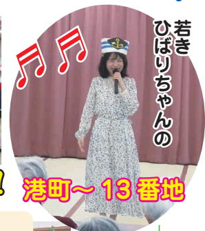
若き ひばりちゃんの