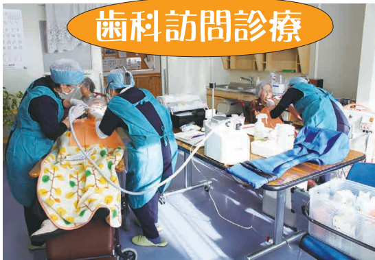
グリーン歯科様による訪問診療(月1~2回)。