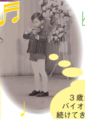
3歳からバイオリンを続けてきました。

Q 仕事で大切なことは？ A ご利用者「寄り添い続けること」につきると思っています。 Q 大切にしていることは？ A 優しい心を持ち続けて生きる事。 Q 仕事をしていて一番大変な時はどんな時？ A お名前とお顔が一致して覚えられない事。そして、一番肝心なご利用者の精神、身体状況を実に頭に入れて動くことが出来なかった時です。 Q 「俺、成長しちゃったなあ」と思う点があれば教えてください。 A ご利用者から名前と呼ばれて話しをするようになった事と、それ以外のご利用者とも何らかの意思疎通を持つようになった事です。